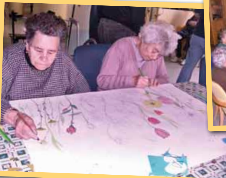
Diamo colore al Centro