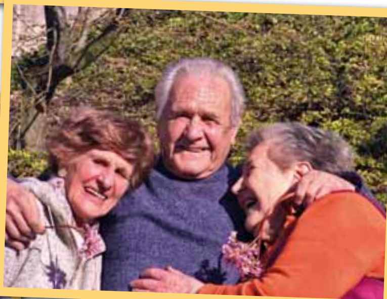
L'amicizia al Diurno