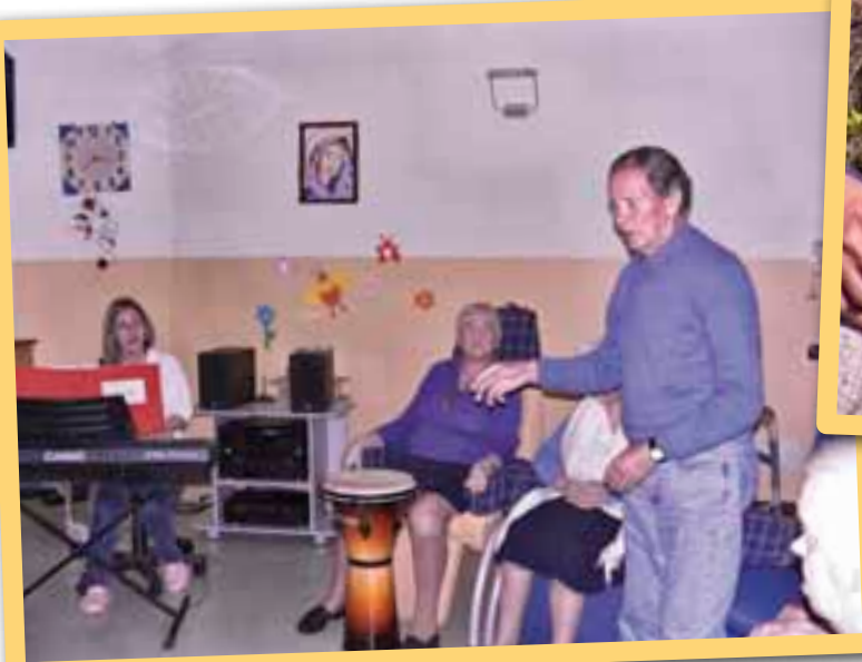
Sentire il ritmo